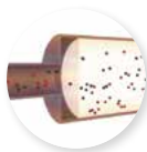
SCR AVEC CLEANR MAX